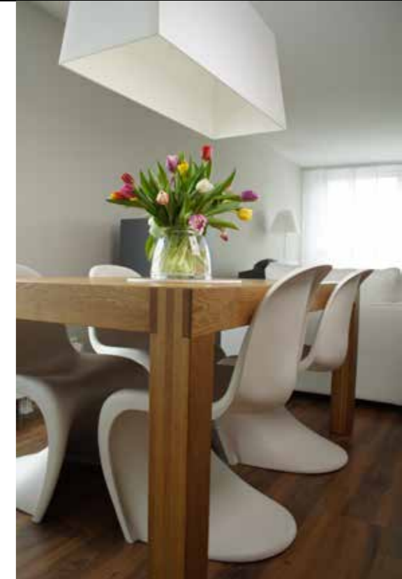
Illustration: Per Lewis-Jonsson © Göteborgs Stad, Miljöförvaltningen